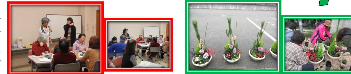
12/12 かたらしてカフェ 認知症サポーター講座 認知症の方へのサポートについて学びました。