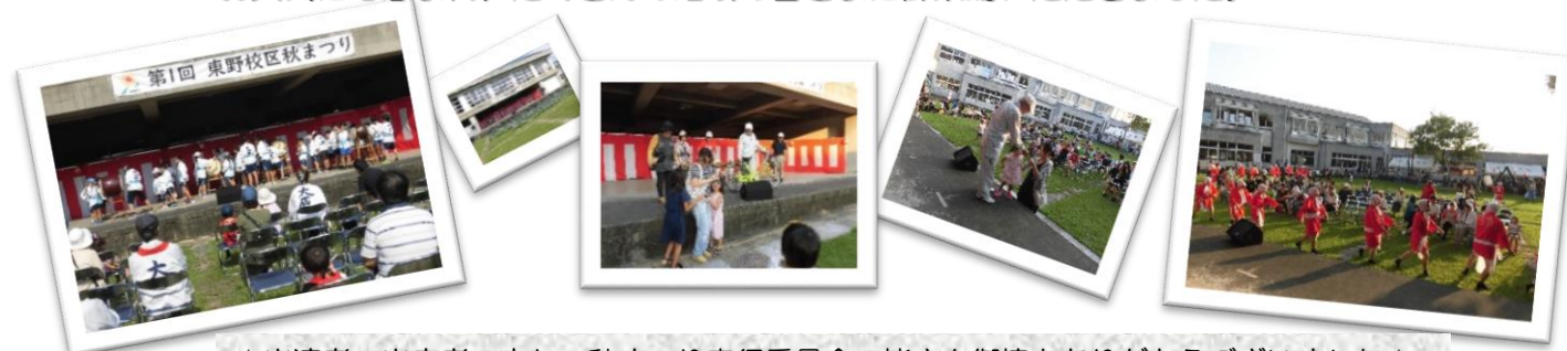
☆出演者・出店者の方々、秋まつり実行委員会の皆さん御協力ありがとうございました☆

9月14日(土)、第1回東野校区秋まつりが、東野小学校中庭で開催されました! お天気にも恵まれ、たくさんの地域の皆さまに御来場いただきました。