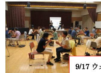
9/17 ウォーキング講座

前半はリズムステップで、脳トレとリズム感の運動でした。みなさん、前半最後は軽やかなステップでした。