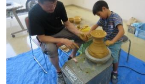
7/26 ろくろ体験 (小石原焼き)