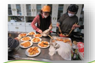
セミナー「お花見パーティ」