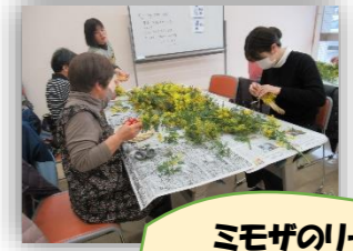
ミモザのリース作り