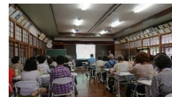
健康福祉部会主催

6月29日、西島区公民館において60人の地 域のみなさんが、認知症という病気の症状 や接し方などについて研修を受けました。 次回は、大原区公民館で実施の予定です。