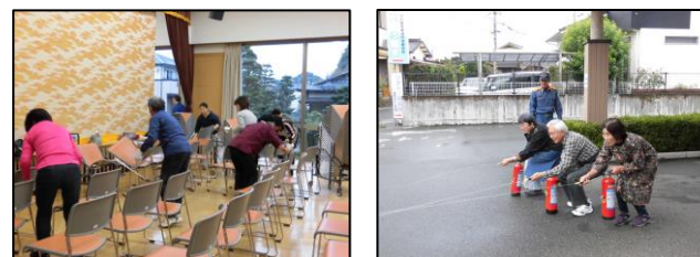
当館ご利用のサークルの方々にご協力頂き、 館内清掃を行いました。 清掃後は、参加者全員で消防訓練を行いました。 雨の中、ご協力ありがとうございました。