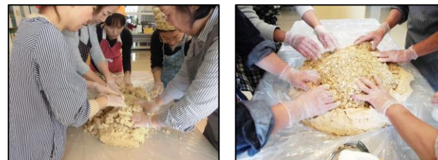
毎年大好評のみそ作り講座！！小郡産の大豆を使い、今年も美味しいお味噌が出来ました！