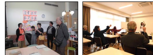
かたらしてカフェで丸山病院を訪問！ 在宅医療や介護サービスについて学びました！