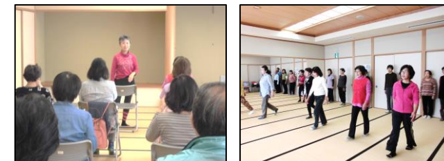
歩くことの大切さを学びました！