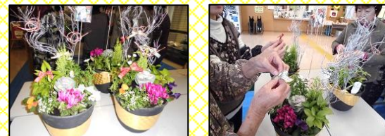
🌸 前回の寄せ植えの様子 🌸

場 所：ひまわり館東野 材料費：②1,500円 ③1,800円 定 員：②10名 11/25×切 ③15名 12/8×切 要予約！ 見本は月末頃に公民館に展示！