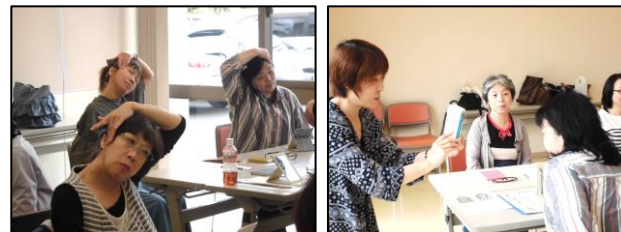
顔の筋トシ 顔ヨガ！！継続は力なり！ 毎日継続していくと必ず効果があります！