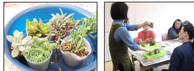
多肉植物の寄せ植えとハンギングの網を作りました！